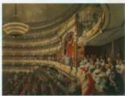
Вид на зал Большого театра. Апрель 1810 года.